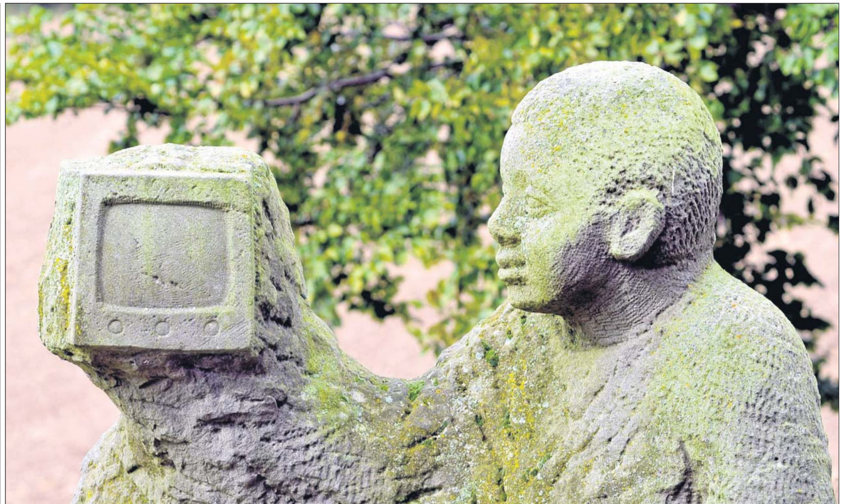
„Zurück in die Zukunft?“. Der Skulpturenpfad soll weitergeführt werden. Ob die Fern-seh-en-de von Stephen Lawson an der Kleinbahntrasse auf ihrem Monitor erkennt, wohin der Weg führen wird?

Das Projekt „Wegmarken“ war von Anfang an als Prozess geplant, das bedeutet: Der Weg sollte fortgeführt werden. An diese Absicht knüpft die neue Ausschreibung des Kulturparlaments an. ■ bs