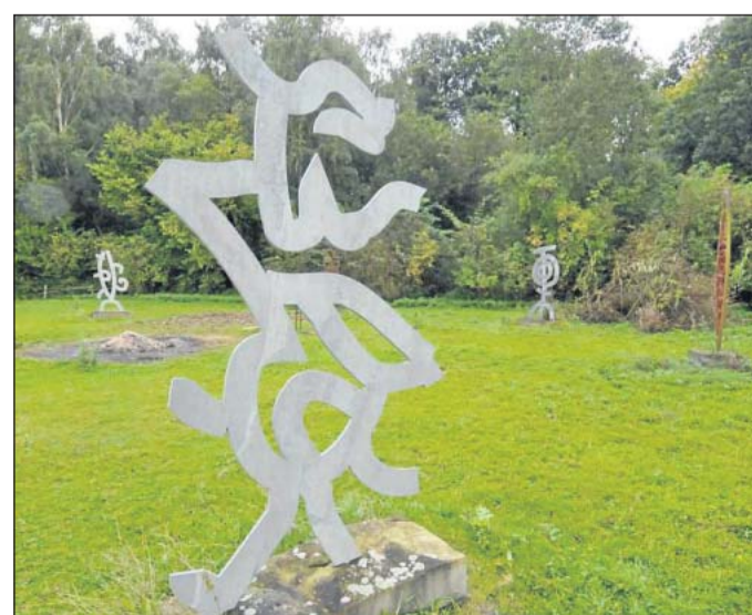
Der „Ring der Kraft“ des 2001 verstorbenen Künstlers Manfred Billinger steht in Bergede.

sen sie ihre Ideen einreichen. Einen Monat später wird die Jury-Entscheidung bekannt-