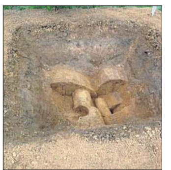
Für den Kunstsalon schuf Marcel Häkel ein Bodenskulptur.

In der abschließenden Diskussion über eine mögliche Erweiterung der Wegmarken um ein letztes „krönendes“ Werk, kam in unterschiedlicher Weise die Idee einer möglichen großen Bodenskulptur für die Hellwegregion am Hang der Haar. Unterschiedliche Ideen wurden mit dem Publikum diskutiert.