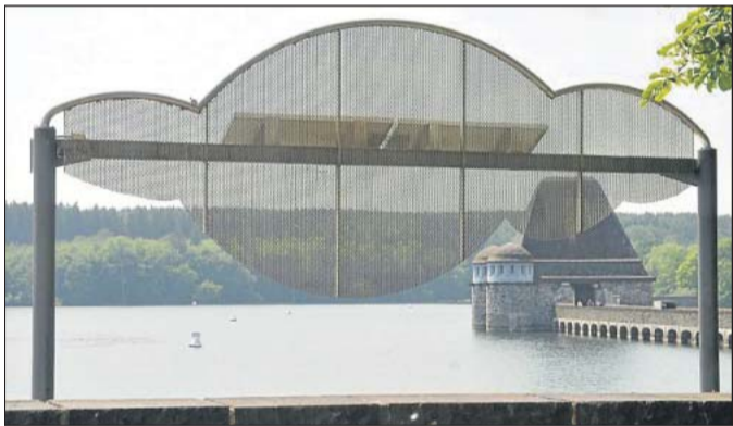
Aus der Wolke am Möhnesee von Horst Rellecke regnet es bei Sonnenschein.